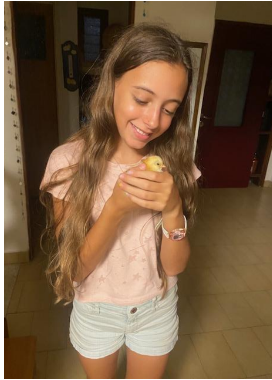
אני מחזיקה את האפרוח ליצי'