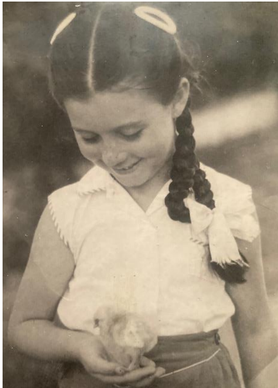
סבתא מחזיקה אפרוח

בין התמונות שמצאנו, גילינו גם תמונה של סבתא מחזיקה אפרוח קטן. התמונה הזו ריגשה אותנו, כי 50 שנה לאחר הצילום של סבתא, גם אני הצטלמתי, ממש לא מזמן, עם אפרוח קטן וחמוד במושב. כשראינו פתאום את שתי התמונות אחת ליד השניה, הבנו עד כמה הקשר בינינו חזק.