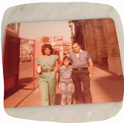
Mis abuelos con mi mamá en Italia en vacaciones de verano.