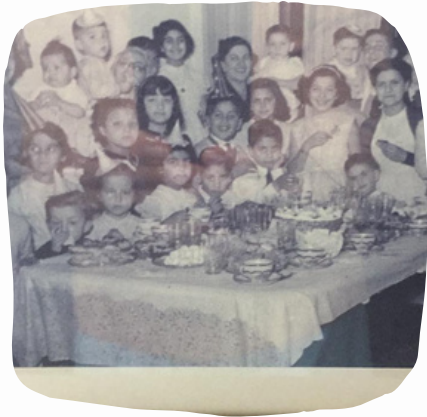
Mi abuela en el cumple de una prima a los 10 años.