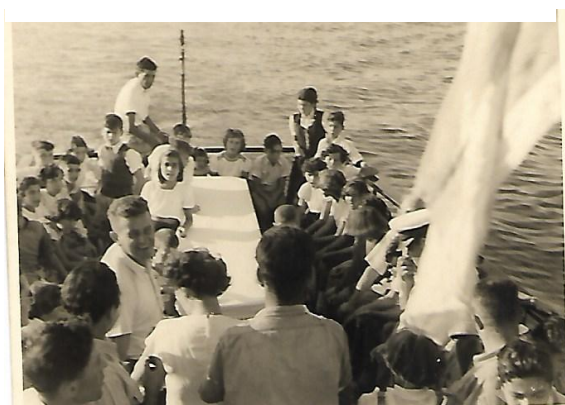
בת מצוה שלי על הספינה "רות" בנמל חיפה

בני משפחתנו של אבי - אחיותיו וגיסיו, וכן אחיה ואחותה של אימי חיו בקיבוצים שונים ברחבי הארץ - שער העמקים, עין דור, יפעת, חניתה - והגשימו במו ידיהם את האידיאל של עבודה עברית ובניין הארץ.