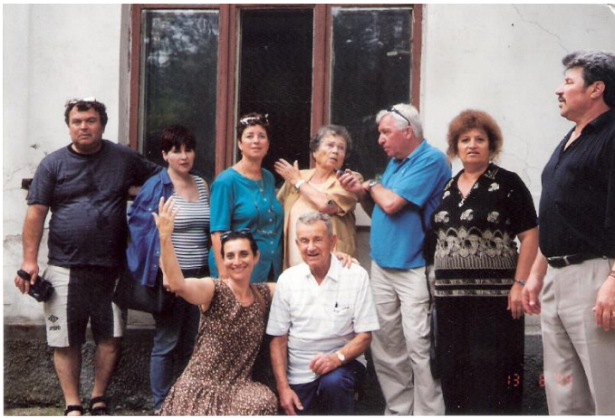
משתתפי טיול השורשים