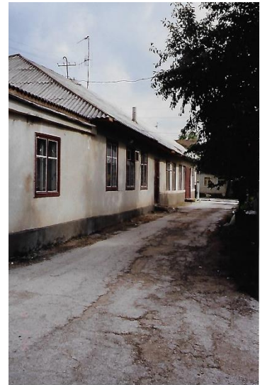
בית הספר בידניץ (1999)

כאמור, סבי ובני משפחתו, משפחת דוברוב, עלו לארץ בשנת 1936. אבי היה אז בן 16. הוא לא המשיך את לימודיו בתיכון, אלא פנה למשימה חשובה יותר. הוא החל לשוטט בארץ ולהגשים במו ידיו את בנייתה. הוא עבד בקטיף בפרדסי השרון, שימש כחלבן בעיר רחובות, ולבסוף הצטרף לקיבוץ ניר-עם, ששכן אז במפרץ חיפה. חברי הקיבוץ עבדו בעבודות מזדמנות באיזור ואבי החל לעבוד בנמל חיפה. הוא התאהב במקצוע ונשאר בחיפה גם כשהקיבוץ עבר לנגב.