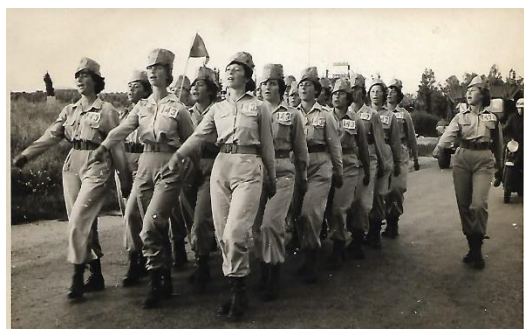
צעדת 4 הימים 1960

כמובן ששירתנו בצה"ל (בדורנו, אלה שלא שירתו, התביישו בכך מאד והשתדלו להסתיר זאת). סבא היה צנחן. בשירות המילואים שלו הוא השתתף במלחמת ששת הימים ובמלחמת יום כיפור. השרות הצבאי שלי היה קל בהרבה. אני מצרפת כאן תמונה מצעדת ארבעת הימים בה השתתפתי, צעדה של עליה לירושלים ברגל, שהיתה תחרותית והשתתפו בה חיילים ואזרחים, תנועות נוער, מפעלי תעשייה ועוד. זה היה אירוע חגיגי ומרנין בעיקר ביום האחרון, בו צעדנו ברחובות ירושלים כשהמונים צופים בנו בשולי הדרך.