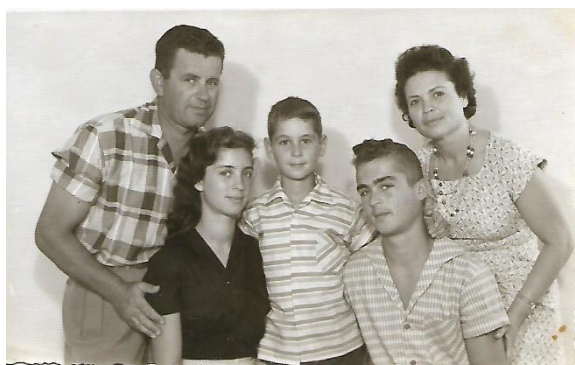
משפחתנו לקראת סוף שנות ה-50

אף על פי שלא השלים את חוק לימודיו, היה, אבי, איש אשכולות. אחרי יום עבודה פיסי מתיש, היה חוזר הביתה ומקדיש שעות ללימוד בתחומים מגוונים. הוא השלים בקורסים את הידע שנדרש לו לצורך עבודתו (טכנאי מכונות), במקביל לימד עצמו שפות, ספרות יפה ועוד... תמיד אפשר היה למצוא אצלו תשובות לשאלות משעורי הבית (אף כי לא תמיד היתה לי הסבלנות להקשיב לו). אהבתי להקשיב בחברתו לתקליטים של מוסיקה קלסית, שנקנו למרות התקציב המשפחתי המוגבל.